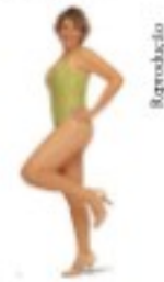
A primeira capa de Regina, pág. 2